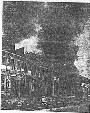
May 13th in Kuala Lumpur. Shop-houses going up in fire in Kampong Pandan.