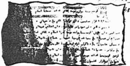
سیاکن فرقه سووہ بیخ داریمہ فرقه سلطان